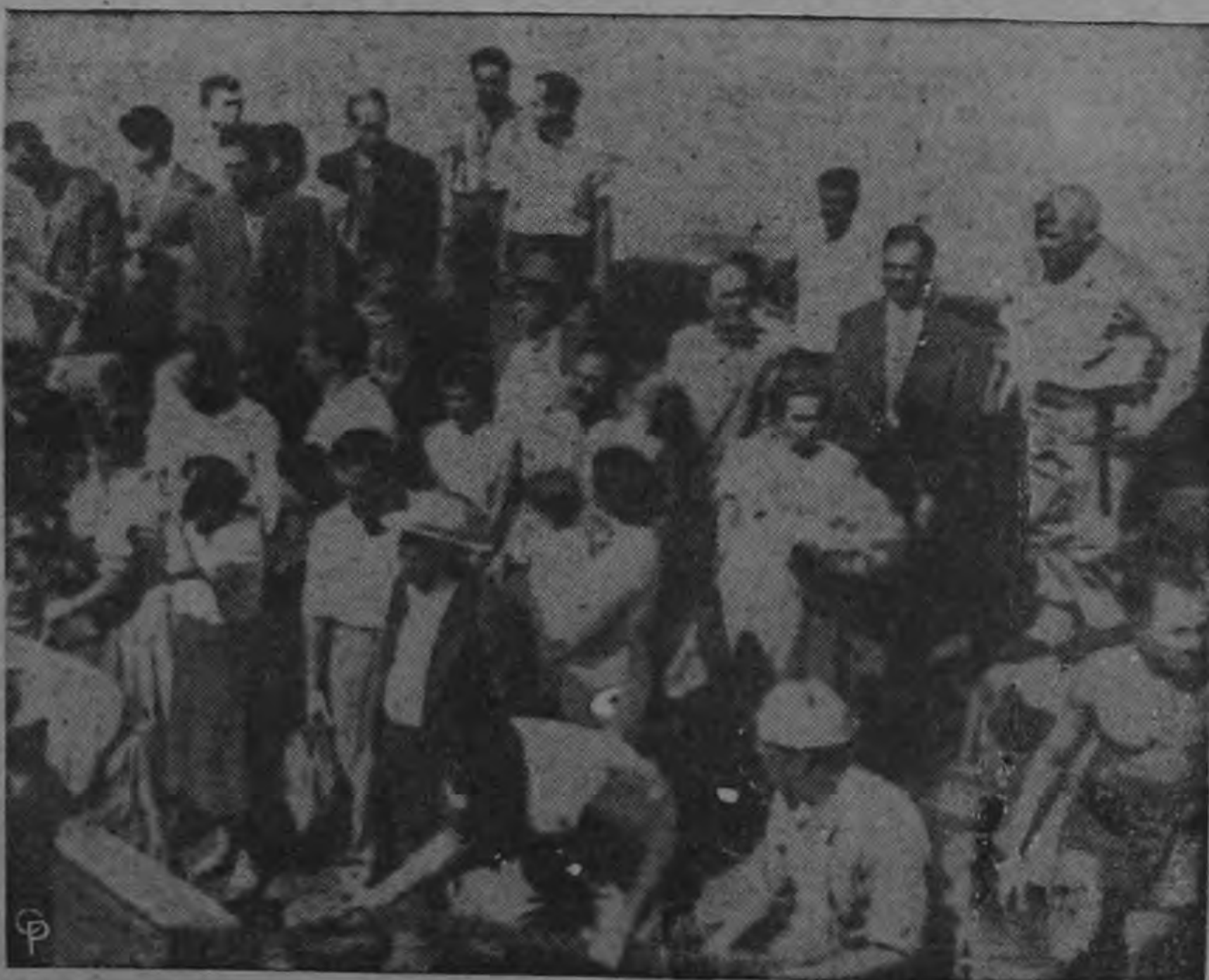
VIAJABAN EN EL SANTA MARIA.—Algunos de los pasajeros que viajan a bordo del barco "pirateado" por enemigos del actual régimen portugués aparecen a bordo de un lanchón que los conduce al puerto de Recife, Brasil, luego de ser puestos en

Por eso pide a los diputados que apoyen moción separando una partida del proyectado impuesto en favor de la Cruz Roja y de los Scouts. Esta partida serviría para incrementar la formación y actividad de los Clubes 4-S.